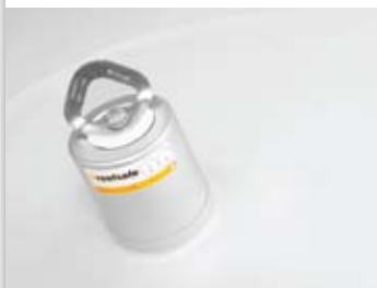
Stand-alone verankering voor kunststof dak.