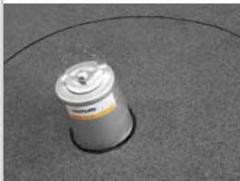
Stand-alone verankering voor bitumineus dak.