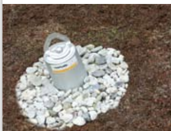
Stand-alone verankering voor groen dak.